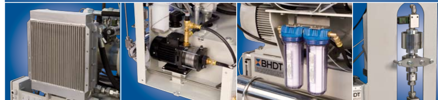
Für die Antriebshydraulik steht auch ein Öl/Luft-Kühler zur Verfügung.

werden nach der Maschinenrichtlinie 98/37/EG und der Druckgeräterichtlinie 97/23/EG hergestellt. Abhängig von der Art der Einzelmodule, ist entweder eine Herstellerklärung oder eine Konformitätsbescheinigung mit CE Kennzeichen in der Dokumentation enthalten.